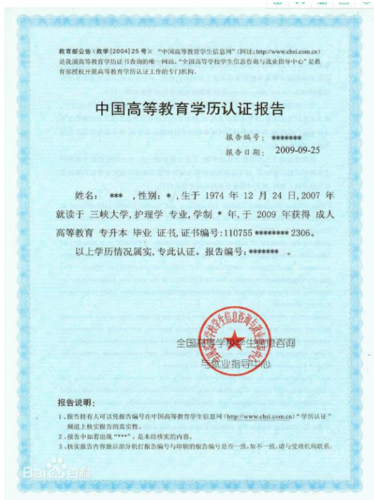
教育部学历认证报告照片示例