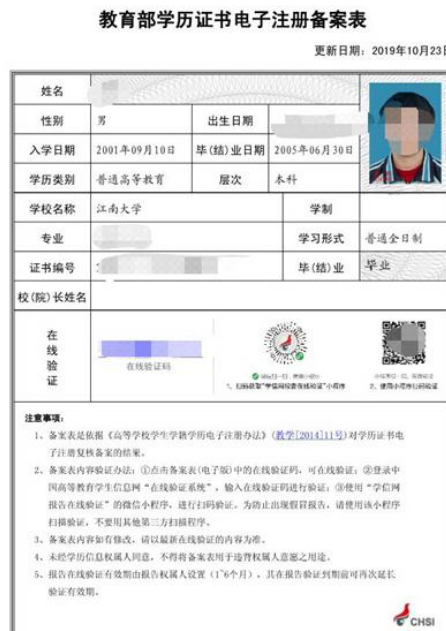
教育部学历证书电子注册备案表照片示例