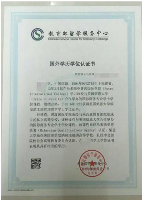
教育部留学服务中心出具的认证报告照片示例

8. 未取得毕业证的自学考试和网络教育本科生（须于录取当年入学前取得国家承认的本科毕业证书）提供省市自学考试办公室或高校出具的相关证明（如盖章的成绩单、届时能够毕业的证明原件照片）。