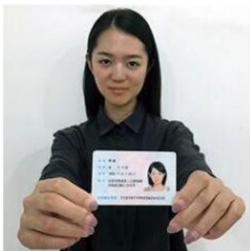
手持身份证照片示例