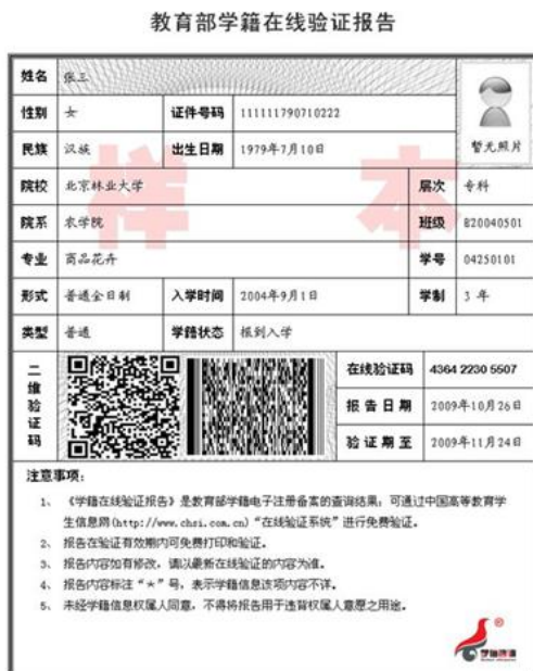
教育部学籍在线验证报告照片示例